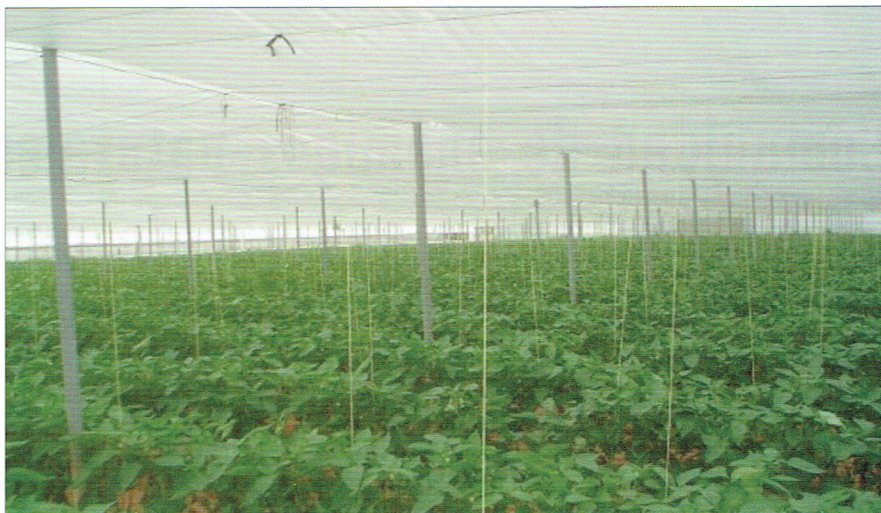
Figura 1. Interior de un "invernadero Mediterráneo" característico del sureste ibérico.

Para la identificación de las especies de hemípteros esternorrincos se utilizaron las claves de Remaudiere (1990) y Blackman y Eastop (2000). Para la identificación de las especies de parasitoides de pulgones se utilizaron las claves de García-Mercet (1924), Ferrière (1965), Stary (1976), Hayat (1983), Pennachio (1989) y Ölmez et al. (2003). La identificación de las especies de dípteros sírfidos se realizó con las claves de Van der Veen (2004), y los dípteros coenósidos se identificaron con claves específicas para estos agroecosistemas facilitadas por el Dr. A. Pont, especialista en esta familia de dípteros. Los coccinélidos fueron identificados con las claves de PLAZA (1979). En todos los casos, las identificaciones fueron contrastadas con el material depositado en la Colección Entomológica de la Universidad de Alicante (CEUA), ubicadas en el CIBIO (Centro Iberoamericano de la Biodiversidad).