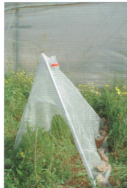
Figura 2. Trampa Malaise modificada situada entre la vegetación natural en el exterior de los invernaderos.

Para los datos de abundancia acumulada, en 2006 se registró un total de 5007 individuos estudiados: 4334 depredadores y 673 parasitoides. Para el 2009, se obtuvo una abundancia de 11204 individuos: 8813 de depredadores y 2391 de parasitoides.